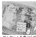
わんちゃんも食べられるパウンドケーキ(80円)

一日中モーニング(ドリンク代 400円) 岐阜県岐阜市茜部本郷 1 丁目 6 営業 10:00~15:00 (L.O14:30) 定休日 日祝日 TEL: 058-201-3317 P有